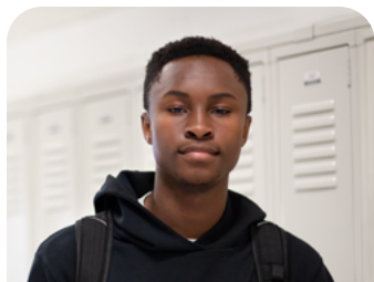
Con Base en el Bachillerato (High School Based)

Tome cursos selectos de Frederick Community College (FCC) en su bachillerato de las Escuelas Públicas del Condado de Frederick (FCPS) o en el Centro Vocacional y Tecnológico. Obtenga su diploma de bachillerato y créditos universitarios de FCC al mismo tiempo.