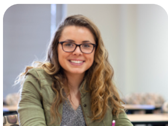
Campus Abierto (Open Campus)

Los estudiantes de bachillerato en este programa toman cursos de FCC en su bachillerato durante un día escolar normal. Estos cursos son de nivel universitario con créditos reconocidos impartidos por maestros de FCPS. Los cursos disponibles varían por escuela; hable con su consejero para ver qué se ofrece en su bachillerato FCPS. Los estudiantes con Base en el Bachillerato reciben un descuento en la colegiatura de FCC.